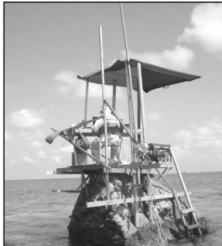
ND2T opérant sur le rocher no. 1

Les photos qui suivent nous montrent une DXpédition sur quelques-unes des plus petites îles au monde faisant partie du récif de Scarborough.