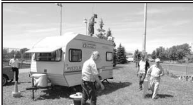
Field Day 2006