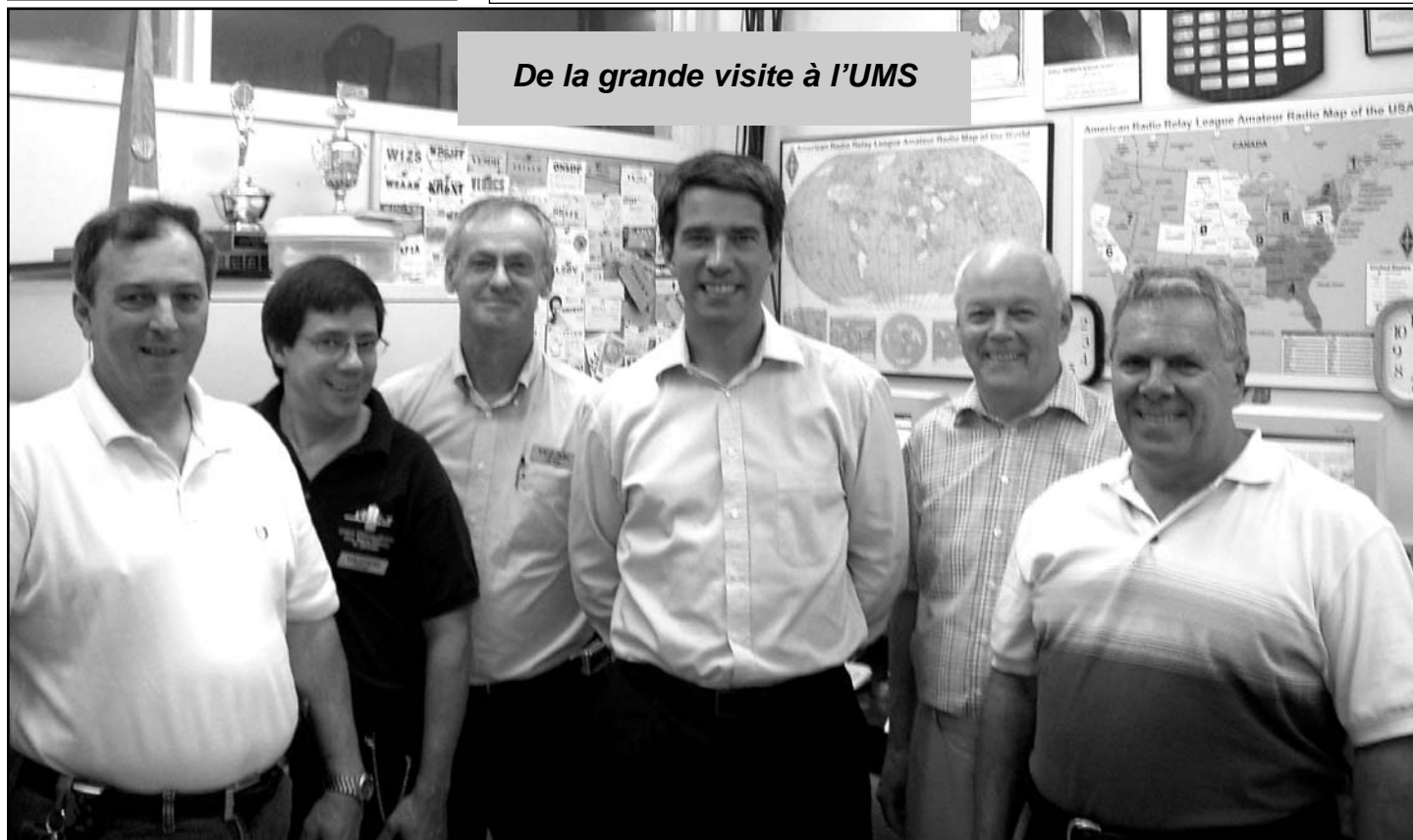
De la grande visite à l'UMS

Prochaine réunion: Le 20 septembre 2006 à 19h30 au 12125 rue Notre-Dame Est